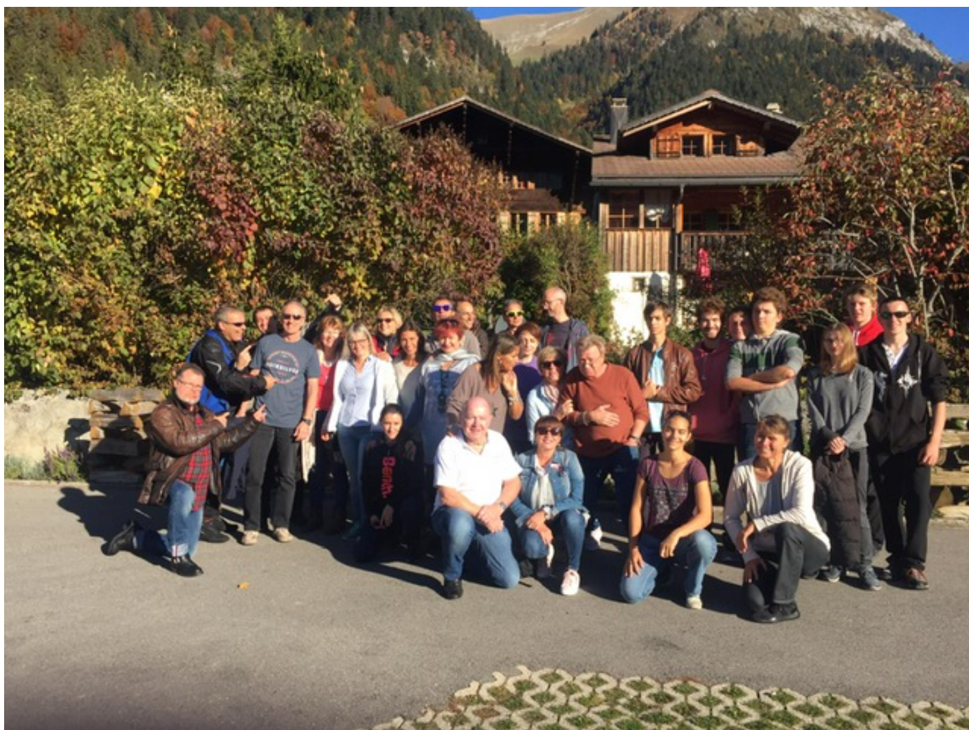
Photo de groupe réalisée en octobre dernier lors de la 20ème édition du stage de Ju-Jitsu pour les adultes de Château d'Oex.